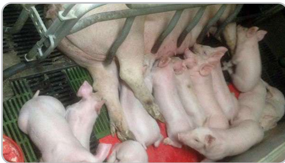
Figura 3. Cerda lactante

También hemos visto un incremento en la ingesta total del pienso de lactación cuyo resultado es mayor homogeneidad y peso de las camadas. Esto también ha reducido las bajas y los lechones atrasados en transición.