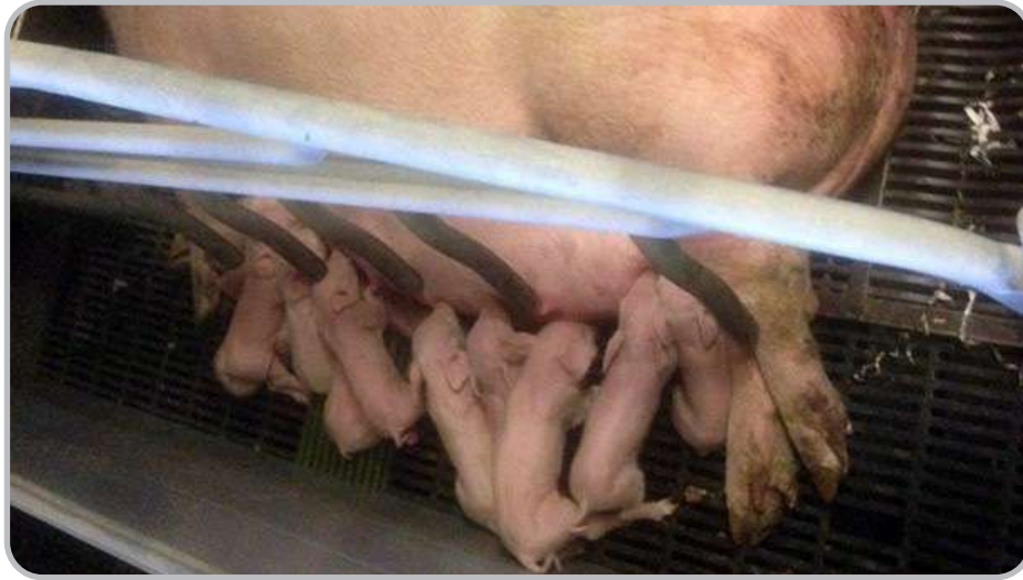
Figura 2. Cerda recién parida.