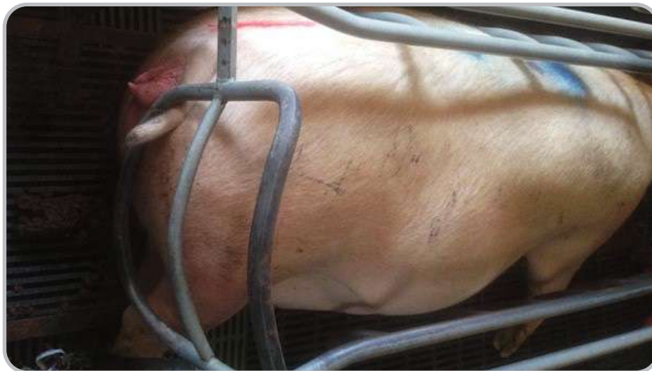
Figura 1. Cerda recién entrada en maternidad.

Uno de los principales problemas a los que se enfrenta la producción con cerdas hiperprolíficas es la elevada mortalidad de lechones y el peso de los lechones al destete como consecuencia de la limitada producción de leche.