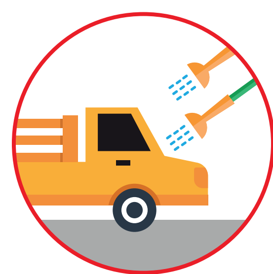
Limpiando los camiones al entrar